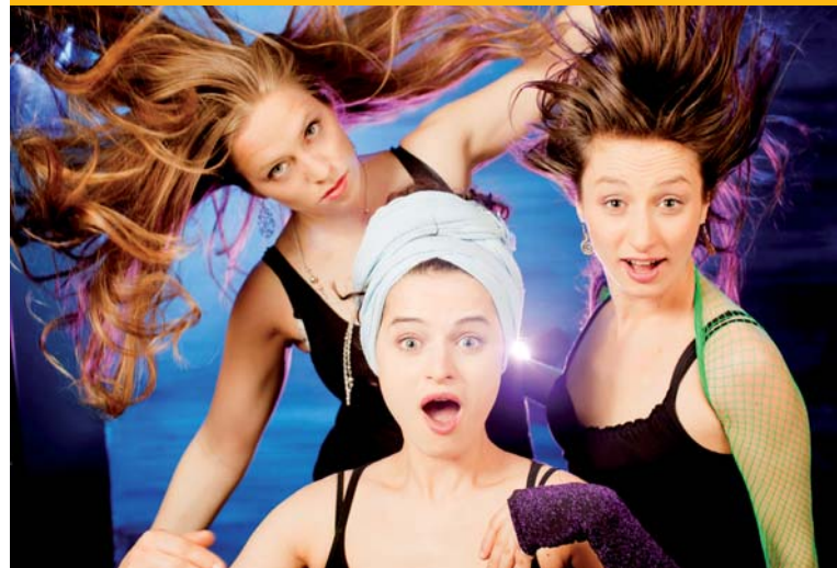
Netnakisum (A) bei der Flensburger Hofkultur