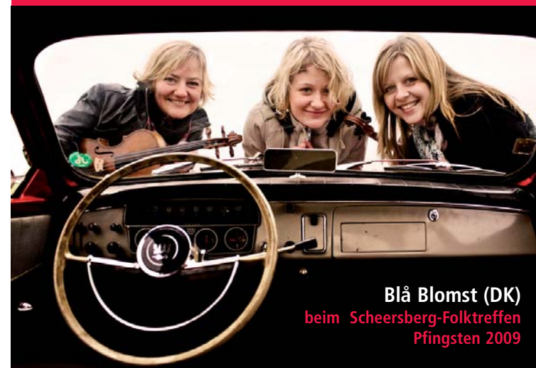
Blå Blomst (DK) beim Scheersberg-Folktreffen Pfingsten 2009